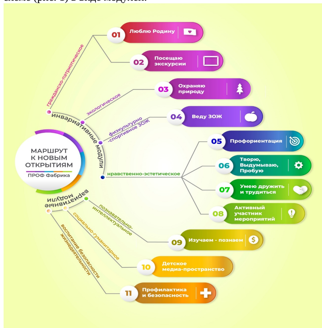
Рис. 1 Отражение воспитательной деятельности через модули (образовательная среда)

Содержание, виды и формы воспитательной деятельности представлены на схеме (рис. 1) в виде модулей: