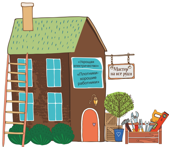
Рис. 2 Настольная игра «Район Профи РЦДО»